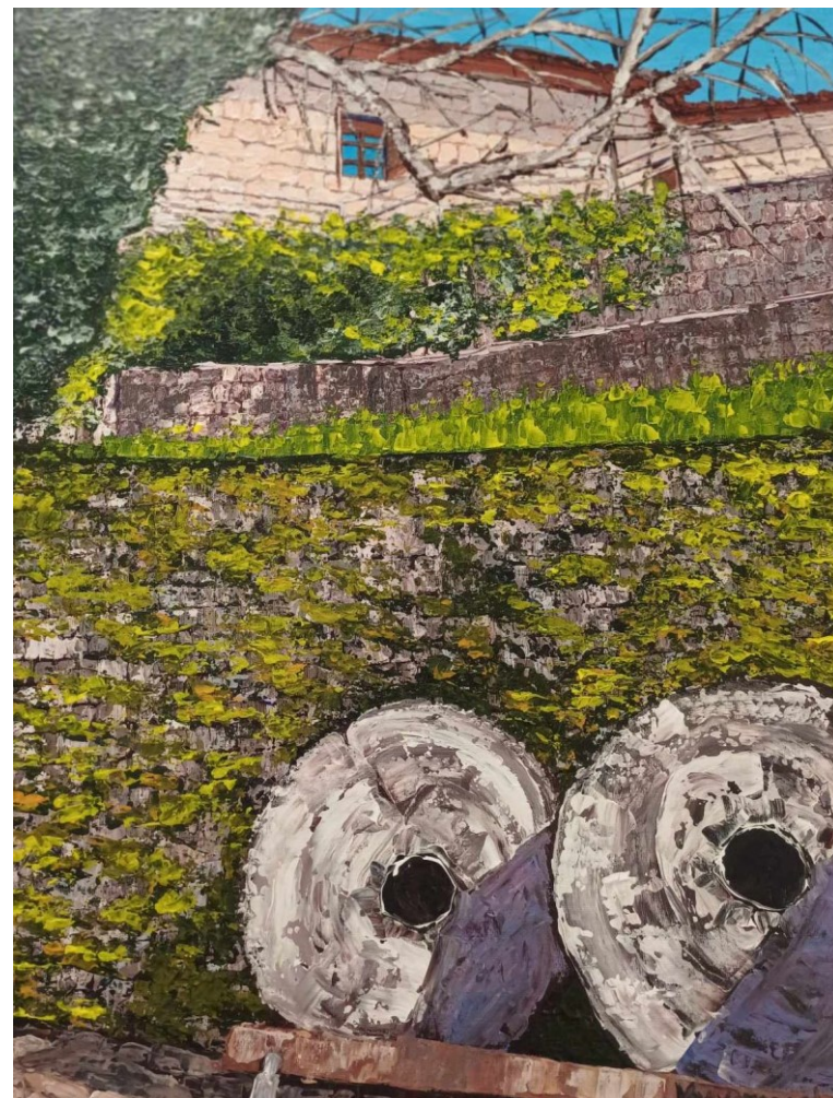
Sylwia Jaguszewska – tekst i fot.